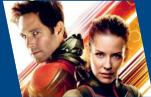
Ant-Man & The Wasp