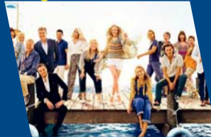
Mamma mia! Ci risiamo