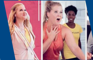
Come ti divento bella